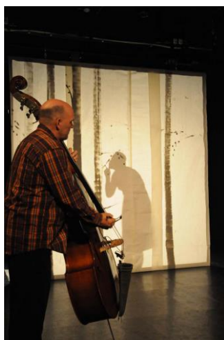
Abb. 4: Szenenbild (Theater Triebwerk)

Etwa fünf Minuten nach Beginn des Theaterstückes sagt einer der beiden Schauspieler, der „Jo“ verkörpert, „Wenn ich heute ein Junge wäre, würde ich mir ein schönes Kleid anziehen. Ja, ich würde mir das schönste Kleid meiner Mutter anziehen, das rote mit dem tiefen Ausschnitt.“ Dieser Satz stammt aus dem Buch. Jo geht hinter eine in der Mitte der Bühne hängende transparente Wand und wird damit zur Schattenfigur. Wir sehen über den Schatten-