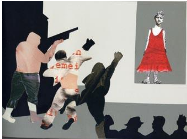
Abb. 6: aus dem Bilderbuch „Jo im roten Kleid“

aus der Dunkelheit aufscheinen und ihre emotionale Wirkung steigern. Als filmisch in einem impliziten Sinne verstehen sich auch die Stationen der Filmerzählung, die Jo durchläuft. Auftritt, Angriff, Flucht, Gewalt und Rettung sind klassische filmdramaturgische Momente, die die Handlung assoziativ ‚zum Laufen bringen‘.