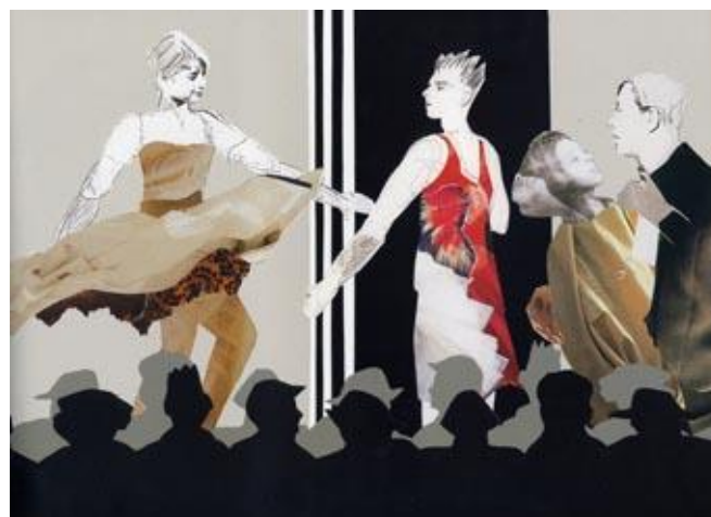
Abb. 9 und 10: Szenenbild aus der Inszenierung „Jo im roten Kleid“ und Seite aus dem Bilderbuch

Auch das Theaterstück steht in solchen transmedialen Bezügen, denn es greift ja das medial und mediengeschichtlich konnotierte Motiv des Jungen im roten Kleid auf. Auf der Bühne kommen nun zwei entscheidende Variationen des Motivs zusammen. Zunächst stellt es (zumindest für das jugendliche Publikum) eine größere Provokation dar, wenn im Gegensatz zum Bilderbuch ein erwachsener Mann mit Glatze in einem roten Kleid auftritt.