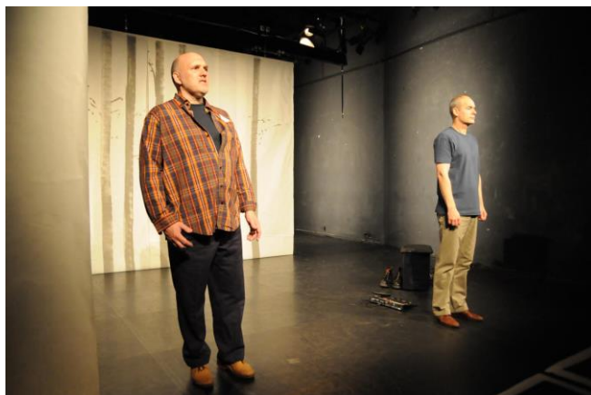
Abb. 3: Szenenbild aus der Inszenierung von 2012 (Theater Triebwerk)

Klar war auch, dass die kleine Erzählung mit ihren 28 Seiten und den 12 Bildern nicht schon ein Theaterstück ergeben konnten. So ist eine der offensichtlichsten Umänderungen die Einbettung der Kerngeschichte in einen erweiterten thematischen Rahmen. Auf der Bühne kommen Fragen und Aspekte zur Sprache, die das Buch nicht explizit thematisiert: Fragen zur eigenen Kindheit, zur Selbst- und Fremdwahrnehmung, zu den eigenen Gefühlen beim Heranwachsen, zu ihren Vorstellungen von Männlichkeit und Weiblichkeit – zu Fragen also, von denen Jugendliche zwischen 12 und 16 Jahren in ihrer emotionalen und sozialen Entwicklung existentiell berührt sind.