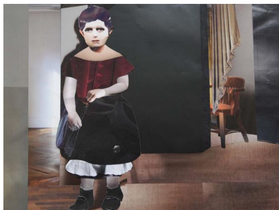
Abb. 11: Jens Thiele: Kindheiten 7 (2012)

Es ging mir darum zu veranschaulichen, in welchen medialen, intermedialen und transmedialen Verflechtungen heute kinder- und jugendkulturelle Produktionen eingewoben sind, ob es sich um Literatur, Film oder Theater handelt. Dabei ist vielleicht deutlich geworden, dass Intermedialität heute mehr ist als eine Übernahme bestimmter Merkmale eines Mediums auf ein anderes Medium. Fast jedes Bilderbuch, jeder Kinderfilm oder jedes Bühnenstück steht heute schon für sich in vielfachen Bezügen zur Mediengeschichte und zu Parallelmedien, ist also bereits selbst inter- und transmedial medial geprägt, sei es durch einen Verweis, die Übernahme eines medialen Zeichens oder durch differenzierte mediale Strukturen. Es geht nicht mehr, wie lange Zeit im Fall der Literaturverfilmung, um die Frage, was vom Medium A in das Medium B übernommen wird, vielmehr sind Inter- und Transmedialität komplexe wechselseitige Referenzsysteme, deren verschiedene Spuren und Simulationen sich zwischen Medienprodukten hin- und her bewegen und denen es nachzuspüren gilt. Das macht Medienanalyse nicht einfacher, aber zumindest spannender und lehrreicher.